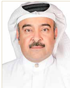
الشيخ هشام بن عبدالعزيز آل خليفة

المتواصل واهتمامه المباشر. وأوضح أن الندوة سيتخللها العديد من المحاور الرئيسية من خلال تواجد كوكبة من الخبراء والاستشاريين والأكاديميين الذين يمتلكون باعاً طويلاً في مرض فقر الدم المنجلي، حيث ستشهد الندوة تقديم أوراق علمية متطورة تهدف إلى مواصلة ارتقاء هذا القطاع المهم. وأوضح إلى أن الندوة سوف تشهد مشاركة فاعلة من المختصين بعلاج فقر الدم المنجلي من أطباء مختصين وممرضين إلى جانب مرضى السكر وذويهم، متمنياً لجميع المشاركين النجاح وتحقيق كامل الاستفادة.