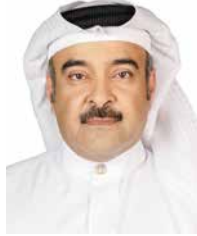
○ الشيخ هشام آل خليفة.

أكد الشيخ هشام بن عبدالعزيز آل خليفة - رئيس مجلس أمناء المستشفيات الحكومية، أن مملكة البحرين تولي اهتماما كبيرا بصحة مرضى فقر الدم المنجلي من خلال تقديم الرعاية الطبية الشاملة والمتكاملة، مبينا أن تنظيم الندوة الثالثة سيسهم في مواصلة العطاء وبذل المزيد من الجهود نحو