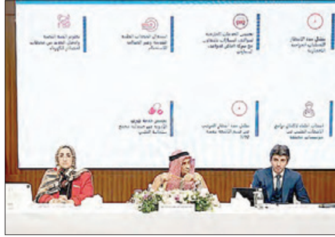
جانب من اجتماع «الأعلى للصحة» مع النواب